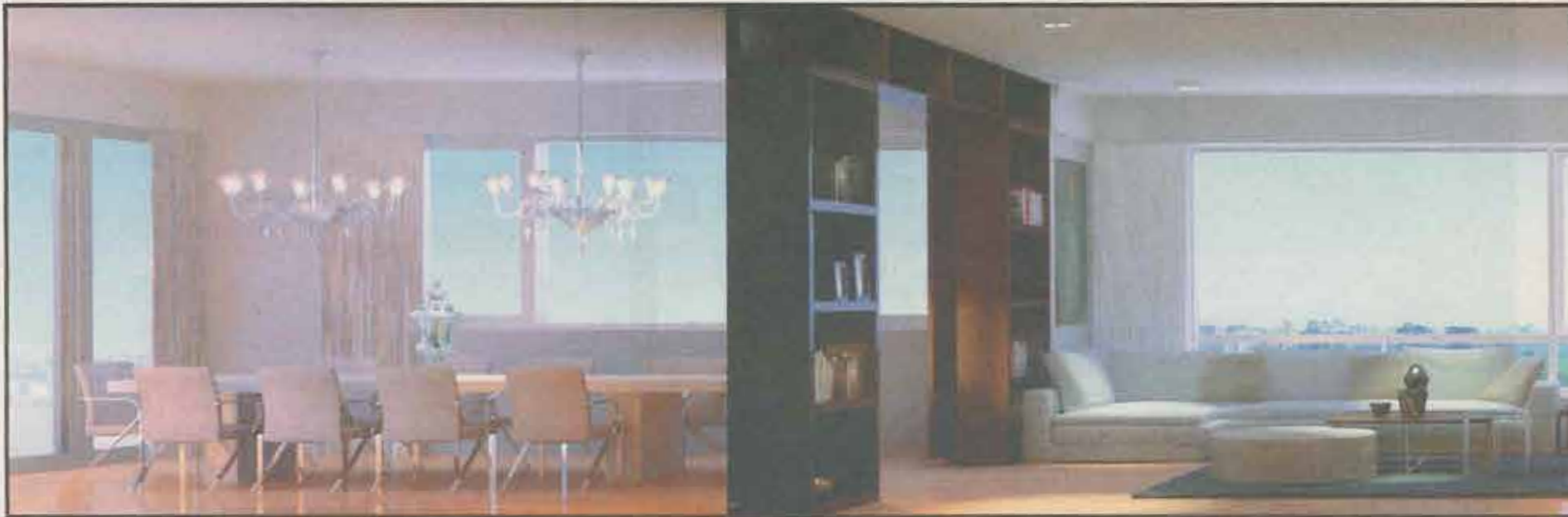
ELEGANCIA AMPLIFICADA. Todas las unidades gozan de superficies de 200 a 410 m 2 . Además, las residencias se entregan con tres metros de altura libre en áreas sociales.