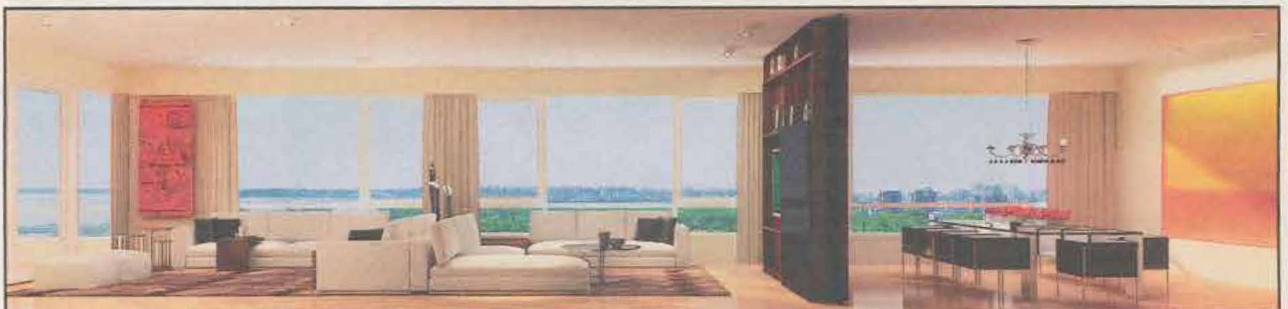
ABIERTO AL MUNDO. Debido al perímetro libre del predio, todos los departamentos tienen visuales al Río de la Plata, bosques de Palermo o al barrio, según la ubicación.