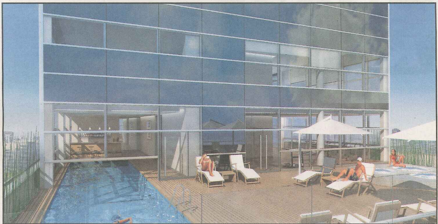
CONFORT EN LA CIMA. En los remates se encuentran amenities como gimnasio, pileta, solárium, hidromasajes exteriores y spa.

Texto: Verónica Mariani.