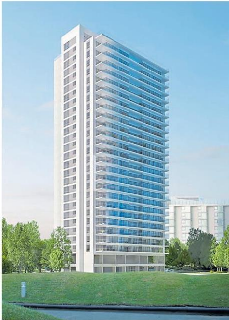
IMAGEN. La torre se caracteriza por la fuerte presencia de vidrio.

Torre Le Parc III. Con 24 pisos y 96 unidades residenciales Premium, el edificio diseñado por MRA+A en La Brava ofrece un diseño exclusivo y completos amenities.